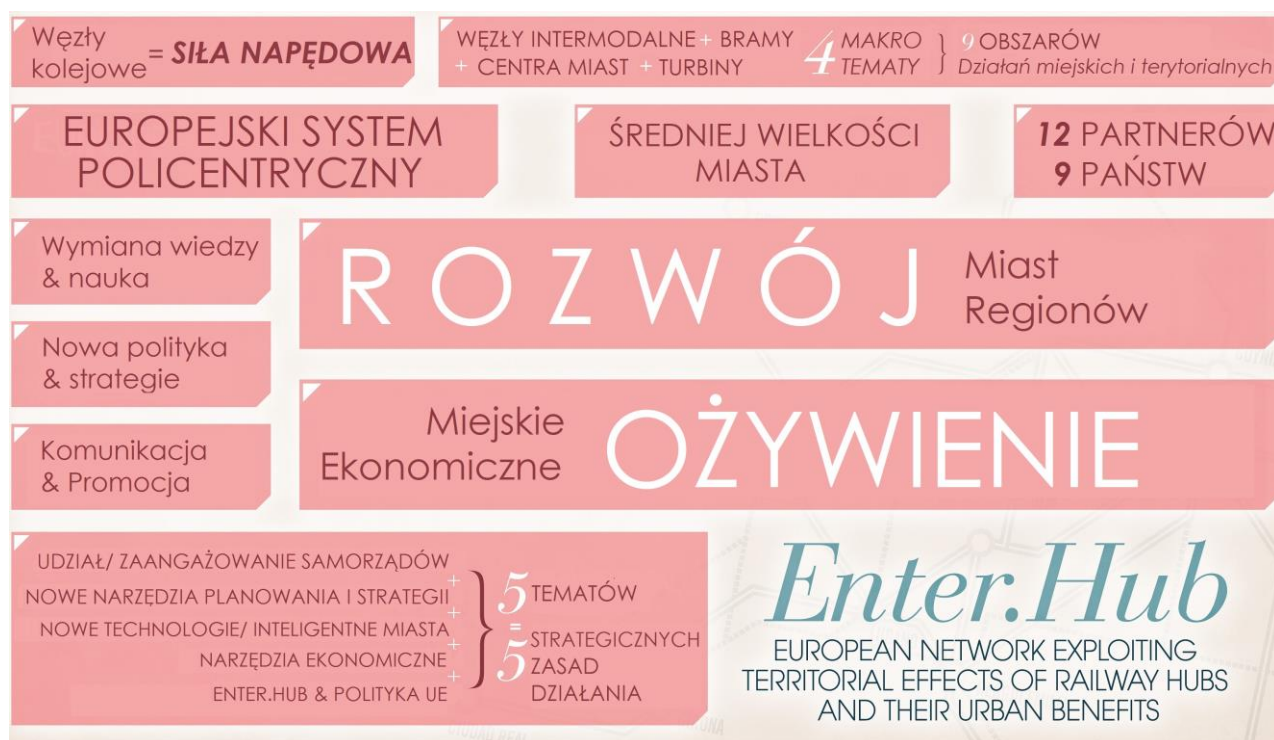
Słowa „klucze” projektu ENTER.HUB

ENTER.HUB promuje kolejowe węzły (intermodalne) o znaczeniu regionalnym, jako siłę napędową dla zrównoważonego, ekonomicznego, kulturowego i społecznego rozwoju, ożywienia miast średniej wielkości. Sieć lokalnych interesariuszy opracuje koncepcję zagospodarowania przestrzeni wokół węzłów, aby wzmocnić swoją pozycję na poziomie lokalnym/regionalnym/ europejskim. Dzięki temu, miasta staną się bardziej atrakcyjne i konkurencyjne, aby przyciągnąć mieszkańców i przedsiębiorców, co jest istotne szczególnie teraz - w dobie kryzysu Zjednoczonej Europy.