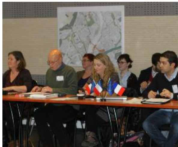
Grupa w trakcie spotkania

Wizyta na dworcu w Creil w fazie jego odnawiania oraz w innych kluczowych miejscach pomogła partnerom w lepszym zrozumieniu miejscowych wyzwań.