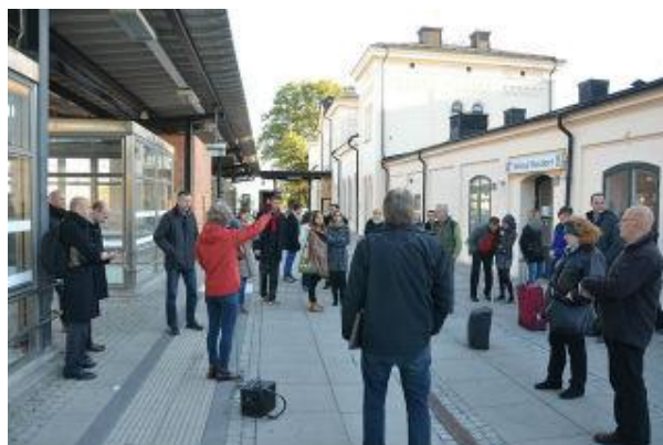
Wizyta na stacji kolejowej w Orebro.

Warsztaty były również okazją do zwiedzenia lokalnej stacji i stref logistyki oraz do zapoznania się z planami miejscowymi oraz narzędziami stosowanymi do poprawienia usług kolejowych i z nimi powiązanych.