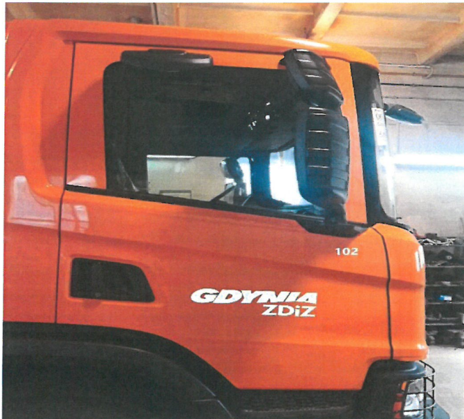
Rys. nr 1. Logo