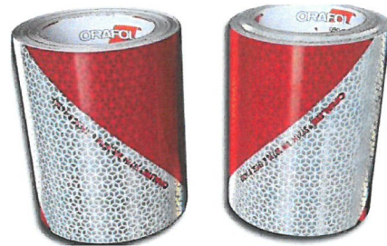
Rys. nr 2. Taśma odblaskowa